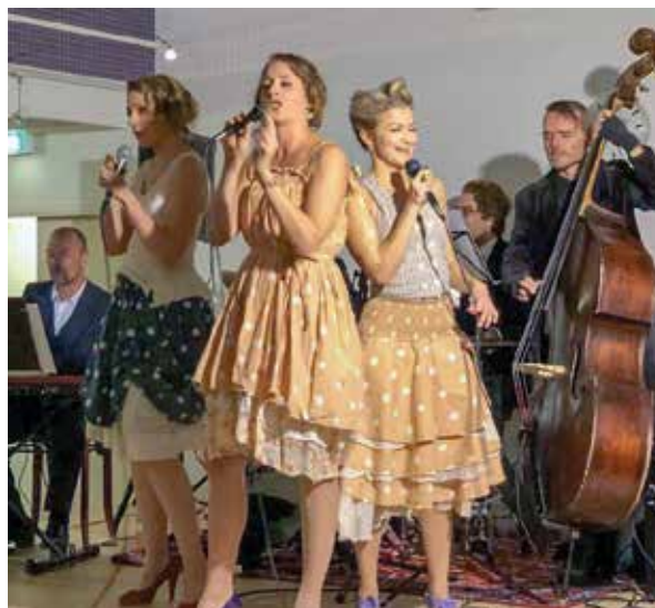
HÖGKLASSIGT. Soul Sisters bjöd på energisk, musikalisk och rolig underhållning på körens 95-årsjubileum.