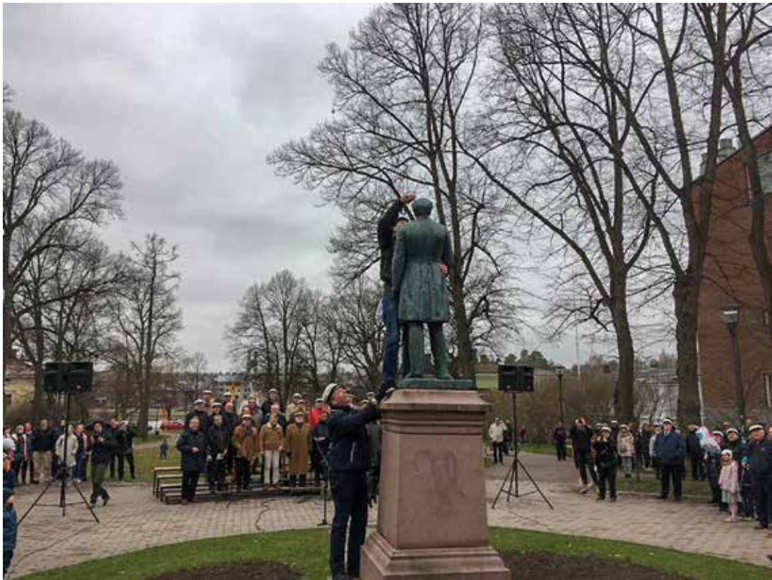
MODIGA MÄN. J.L. Runeberg fick igen sin studentmössa av en dödsföraktande korist på första maj 2018, den här gången under en kulnare himmel än året innan.